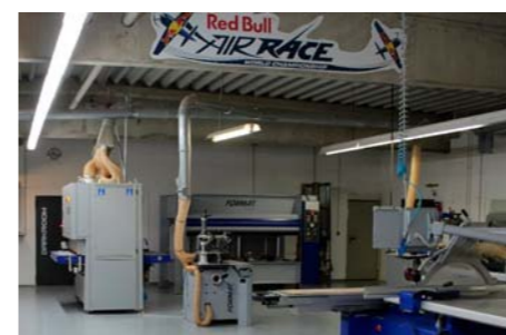
! Alles aus Tiroler Produktion der Felder Gruppe: Formatkreissäge, Schleifautomat und Tischfräse.