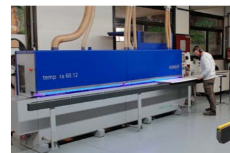
! Der Kantenbearbeitungsautomat Tempora 60.12 liefert programmgesteuerte Bearbeitungsqualität.