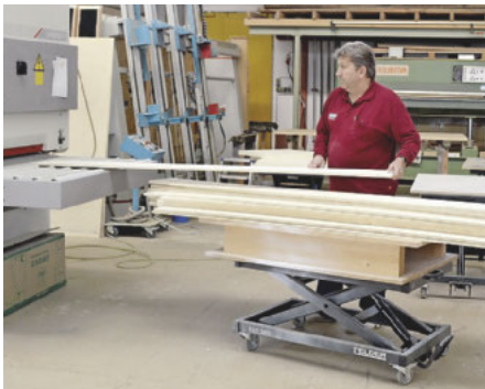
Der Hubtisch leistet gute Dienste beim Beschicken von Maschinen ...