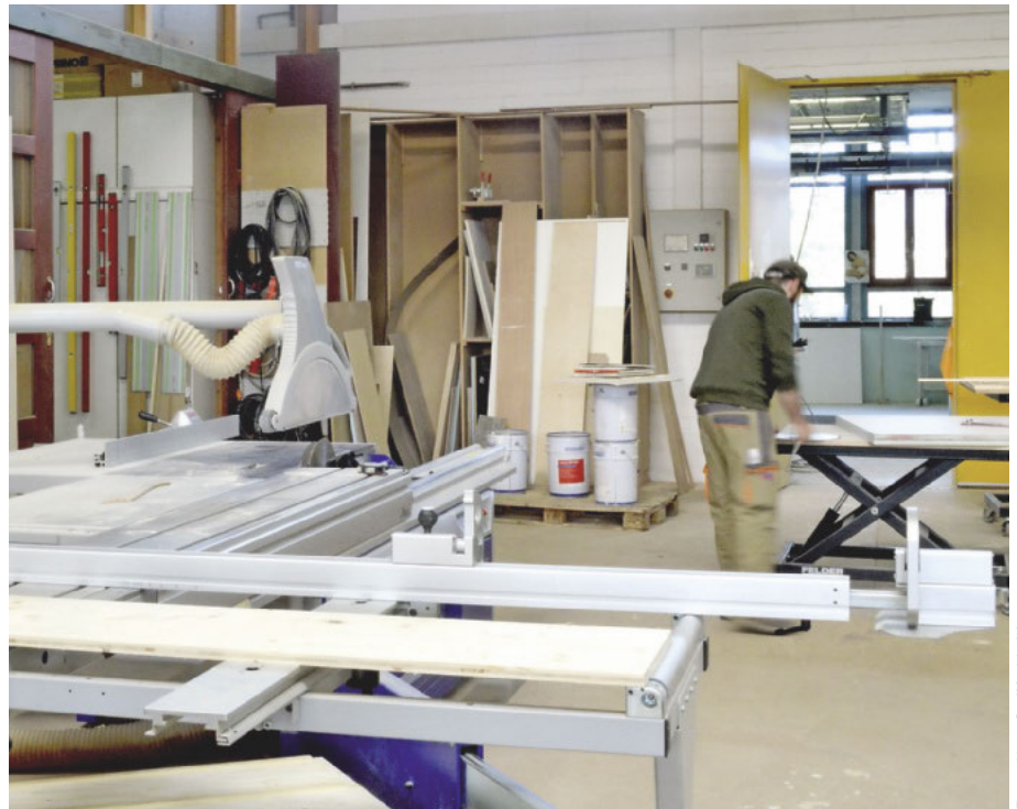
Praktisch: Hubtisch als Rüsthilfe und mobile Ablagefläche beim Sägeblattwechsel an der Kappa-Formatkreissäge