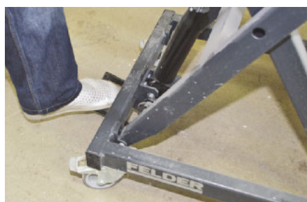
Per Fußpedal betätigt, reguliert ein Hydraulikzylinder die Arbeitshöhe