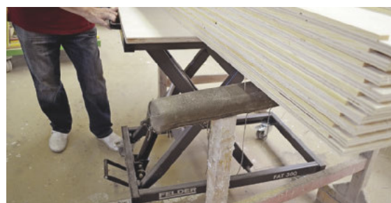
Mobil: Der Hubtisch befördert Lasten quer durch die Werkstatt