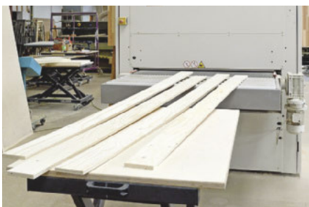
... wie auch als Ersatz für den zweiten Mann am Maschinenauslauf