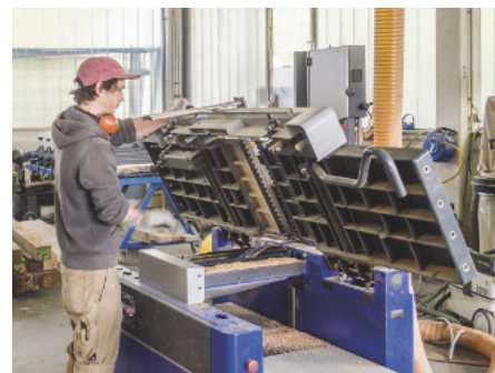
Der Schreiner klappt den Tisch hoch, um die Maschine zur Dickenhobelmaschine umzubauen