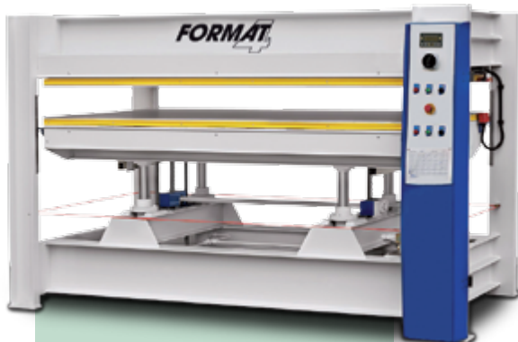
Format 4: Prensa en caliente HVP capacidad de 60t hasta 200t. Las prensas de platos calientes de Format-4 son ofrecidas en tres diferentes versiones: Con mesas a calefacción eléctrica de Elkom®, con calefacción del agua (90°) y con calefacción del aceite térmico (120°)