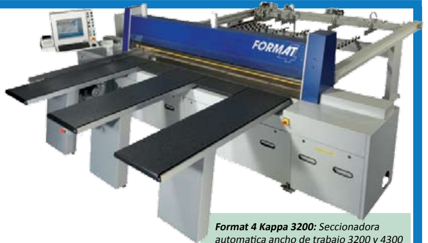
Format 4 Kappa 3200: Seccionadora automática ancho de trabajo 3200 y 4300 mm, de alta velocidad del carro, hasta 100m/min, Control CNC, programación gráfica, sistema Windows.