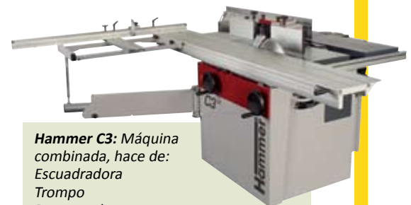
Hammer C3: Máquina combinada, hace de: Escuadradora Trompo Regruesadora Taladro Planeadora