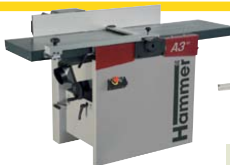
Hammer A3: planeadora y regruesadora con 300 y 400 mm ancho.