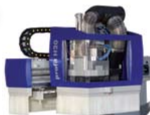
Format 4: H 20-H30: La CNC a la medida su negocio, completamente equipada, versátil, confiable, fácil a operar. CNC a la medida su negocio, una gama completa para la industria de madera.