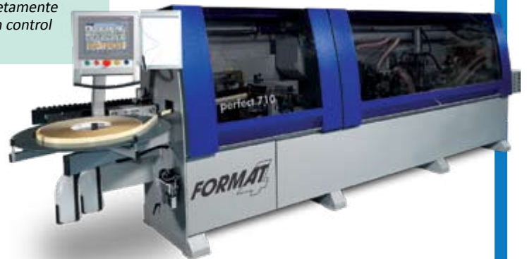
Enchapadoras de cantos Seire Perfect 610 y 710: La línea industrial de enchapadoras del Grupo Felder, completamente equipadas con control numérico.