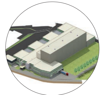
Im November 2018 wird das neue Hochregallager mit knapp 70.000 m 3 Kubatur in Betrieb genommen.

Viele weitere Informationen finden Sie auf www.felder-gruppe.com .