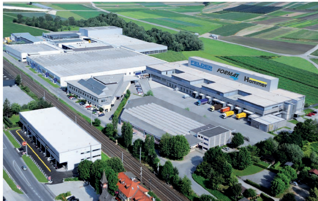
Im Werk in Hall in Tirol produziert die Felder Gruppe Holzbearbeitungsmaschinen für Handwerk, Gewerbe und Industrie.

Aus Tirol in die ganze Welt: Felder Gruppe Holzbearbeitungsmaschinen