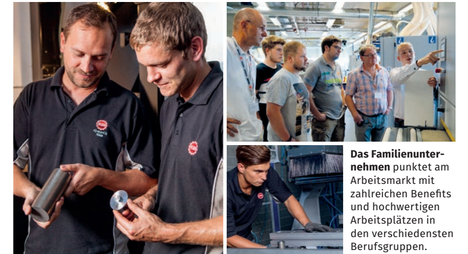
Das Familienunternehmen punktet am Arbeitsmarkt mit zahlreichen Benefits und hochwertigen Arbeitsplätzen in den verschiedensten Berufsgruppen.

Geboten werden diverse Benefits wie die hausinterne Kantine, kostenlose KFZ-Parkplätze oder die volle Übernahme der Kosten für öffentliche Verkehrsmittel (die ÖBB-Schnellzughaltestelle liegt direkt neben dem Werksgelände) und vieles mehr. Weitere Informationen und alle Karrieremöglichkeiten finden sich auf dem Felder Gruppe Karriereportal karriere.felder-gruppe.com .