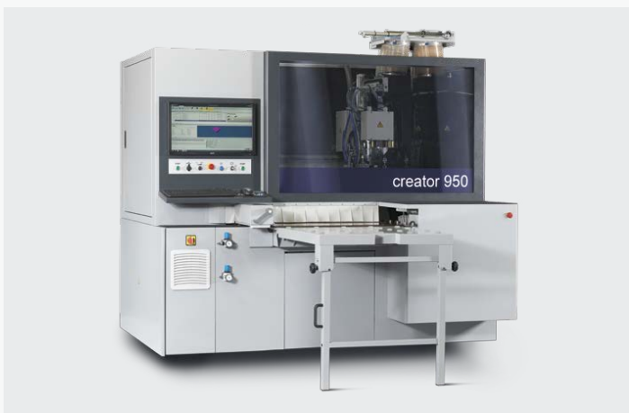
▲ Creator 950 est un centre d'usinage compact aussi puissant qu'un grand et offre une vraie flexibilité de production des pièces unitaires.