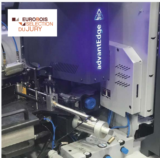
▲ Le système AdvantEdge, développé en interne par Felder, permet de réduire les coûts d'équipement par quatre pour ce système d'encollage à air chaud.