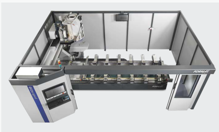
▲ Le système SafeSpace réduit l'emprise au sol d'environ 15% sans pour autant diminuer la capacité de production.

Compact et personnalisable, ce nouveau centre à commande numérique pour l'agencement et l'usinage de portes associe capacité de production et faible encombrement. Creator 950 concentre sur 5m 2 toutes les opérations classiques d'un centre de perçage et d'autres plus complexes comme l'injection de colle ou la pose de tourillons. Le travail à plat limite le déplacement des panneaux et améliore le maintien de la pièce. Le changement d'outil permet de réaliser certaines tâches spécifiques, comme l'usinage de logement de serrure grâce à l'installation d'un renvoi d'angle que l'on trouve généralement sur des centres plus importants. Sans être un centre d'usinage de portes en série, Creator 950 apporte une réelle flexibilité aux professionnels recherchant une polyvalence ou souhaitant délester une ligne de production. Idéal pour la fabrication de pièces unitaires, il réduit le temps de préparation par un démarrage immédiat sans positionnement de traverses ou de ventouses. ■