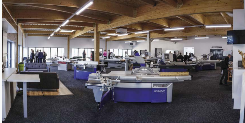
▲ Le showroom, nouveau centre névralgique de la marque en France, a ouvert en mars dernier.