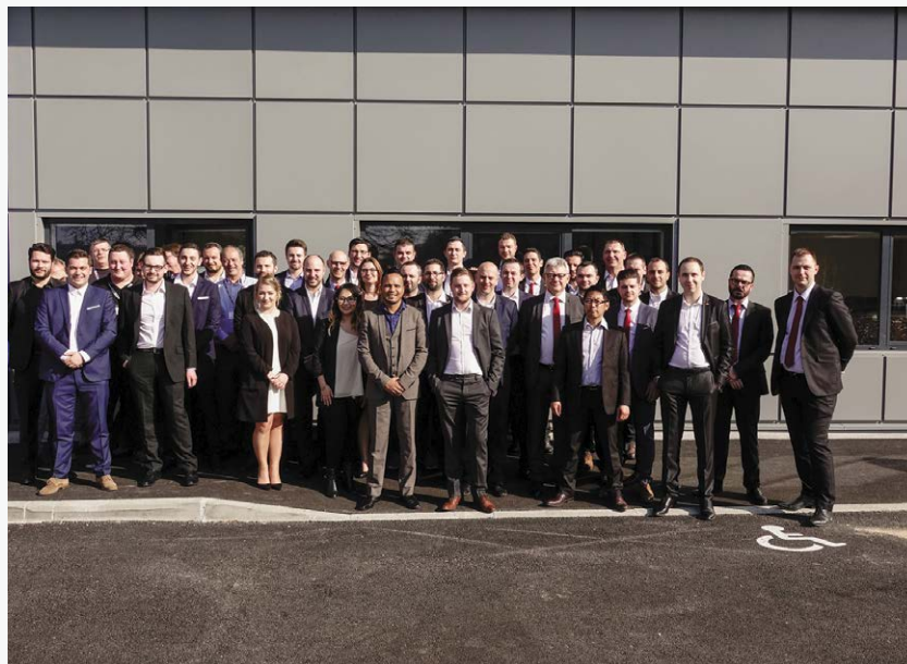
▲ Felder France, c'est, aujourd'hui, une équipe complète dans l'ensemble du territoire français.