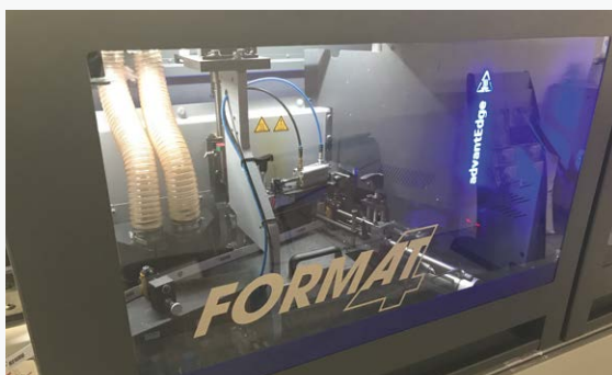
▲ Dès cette année, il pourra équiper les différents modèles d'encolleuses de la marque à partir du modèle F600.

Après avoir accompagné au cours des deux dernières années la transformation d'Eurobois en salon de référence pour la filière, Felder sera présent à Lyon sur un espace de 600 m 2 exposant une trentaine de machines.