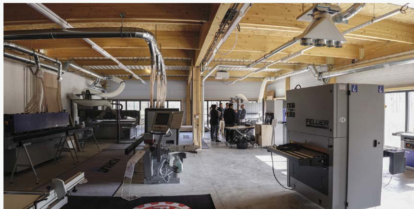
▲ L'atelier sert à la formation interne et à la présentation de solutions techniques spécifiques adaptées aux besoins des clients.